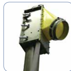
Bocca di scarico in materiale plastico ad alto rendimento