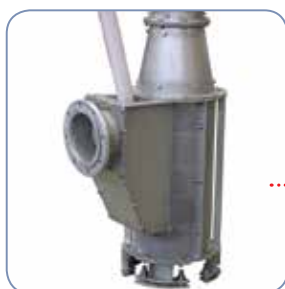
Bocca di carico e vaglio apribile