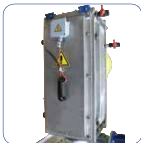
Modulo di scarico isolato